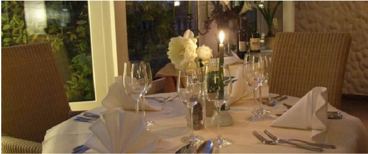
Restaurant mit Kaminzimmer