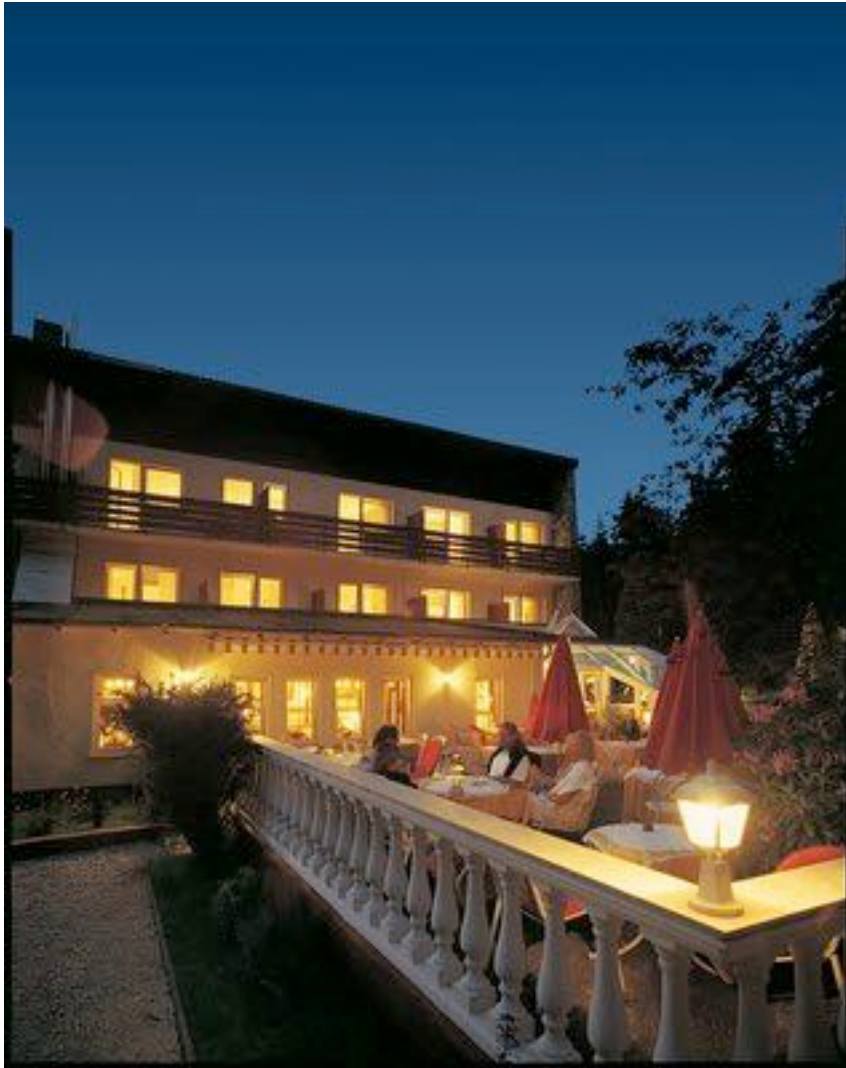
Hotellansicht mit Terrasse