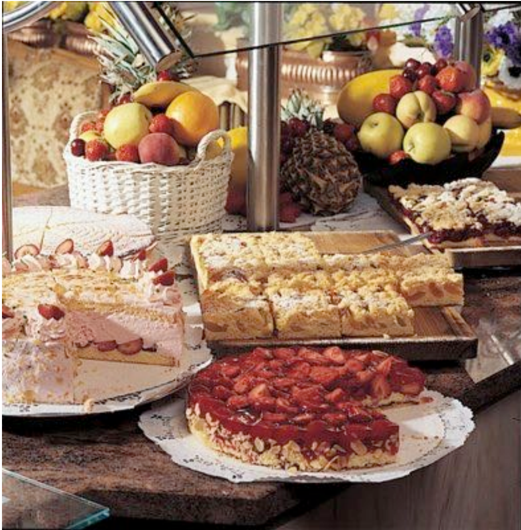
Taglich frische selbstgebackene Torten und Kuchenauswahl