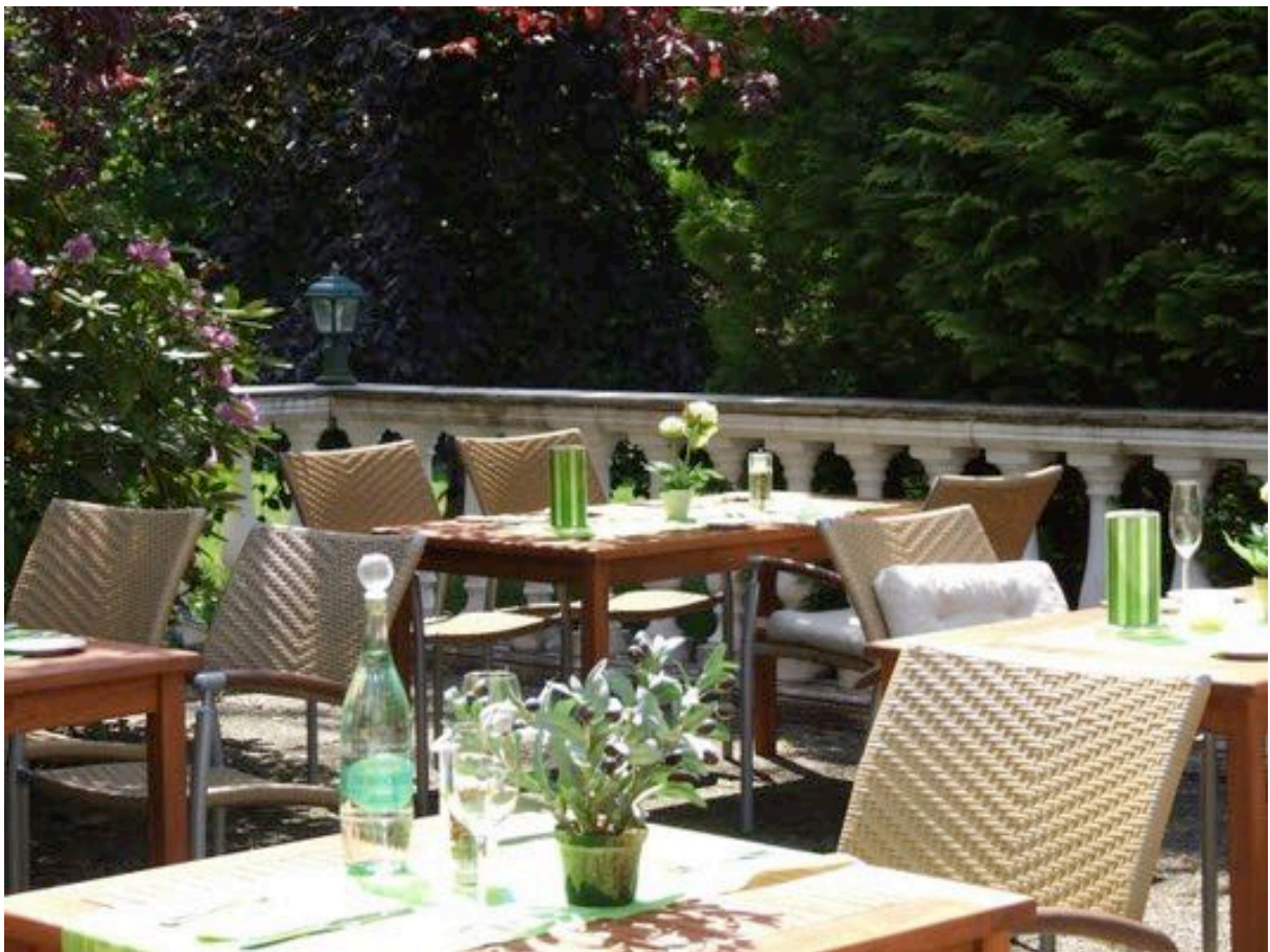
Terrasse im Garten