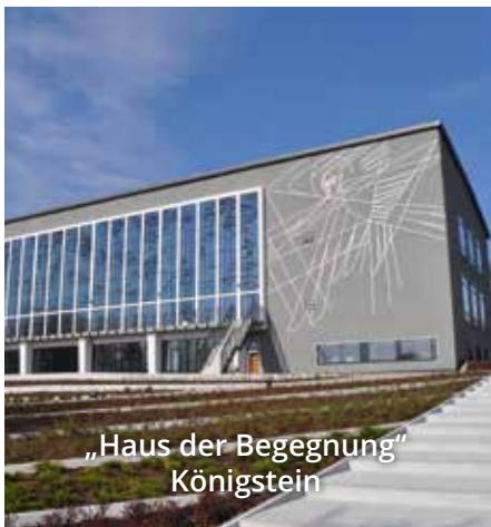
„Haus der Begegnung“ Königstein

Seit über 30 Jahren leitet Brant Konfe- renzen, Workshops und Retreats auf der ganzen Welt. Er ist Mitbegründer