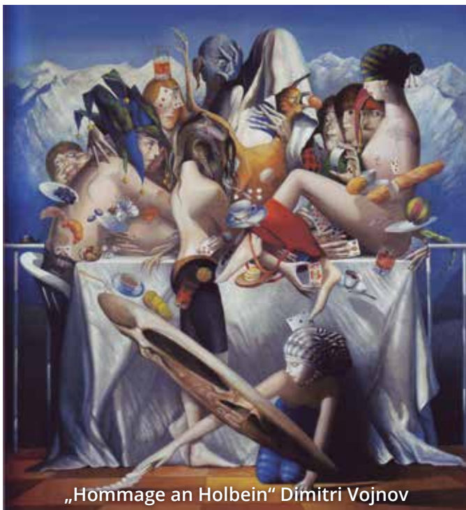
„Hommage an Holbein“ Dimitri Vojnov